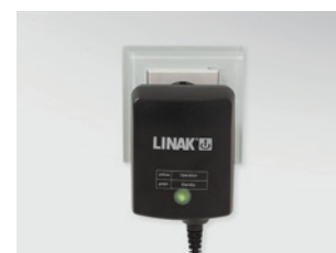
Elektronisches Schaltnetzteil (Switch Mode), direkt hinter Netzstecker integriert