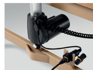
Aufnahmebuchse des Steckers zur Anbindung des elektronischen Schaltnetzteils (Switch Mode)