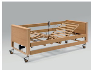
Liegefläche mit Metallstreben