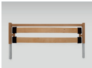
Bettverlängerung inkl. Seitensicherungsholme (auch nachträglich montierbar)