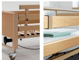
Links: aufsteckbarer Seiten- sicherungsholm Rechts: drehbarer Handlauf